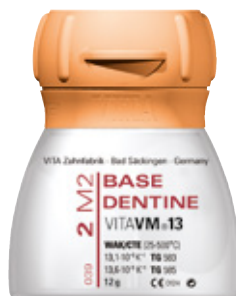
VITA VM®13 Ceramika do licowania metalu.