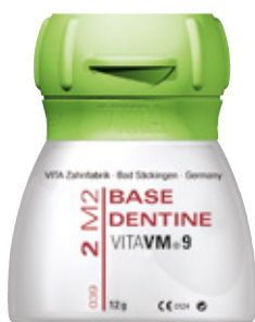
VITA VM®9 Ceramika do licowania tlenku cyrkonu oraz materiałów VITABLOCS.