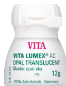
VITA LUMEX® AC Nowa, uniwersalna ceramika do wszystkich popularnych podbudów ceramicznych,