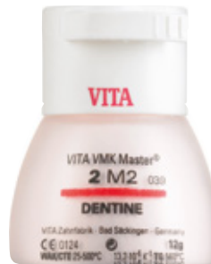
VMK® Master Ceramika do licowania metalu.